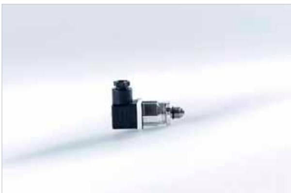
Druckmessumformer für Kältemittelanwendungen

Damit das LiquiSonic® System die Konzentration druckkompensiert bestimmen kann, wird ein Drucksensor im Messsystem integriert. Der Druck wird durch ein analoges Signal 4...20 mA in den Controller eingespeist und verrechnet.