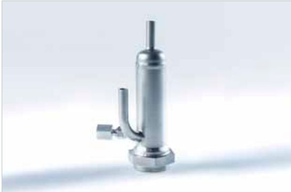
Durchflussadapter für Kältemittelanwendungen

Für die einfache Sensorintegration in den Prozess ist der Durchflussadapter ideal. Dieser ist in verschiedenen Bauformen erhältlich. Beim Ein- und Auslauf handelt es sich standardmäßig um ein Rohr mit 12 mm Durchmesser (OD), das mit passenden Fittingen bestückt werden kann. Zusätzlich ist die Integration eines Drucksensors im Adapter vorgesehen.