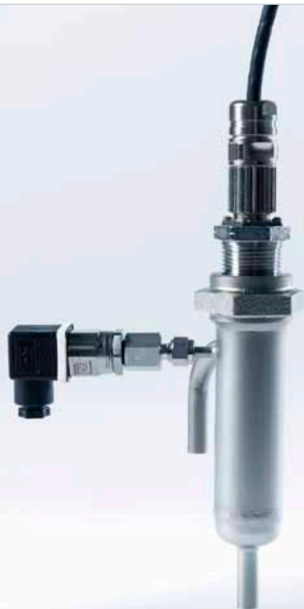
LiquiSonic® Systemaufbau - Ultraschallsensor und Drucksensor integriert im Durchflussadapter