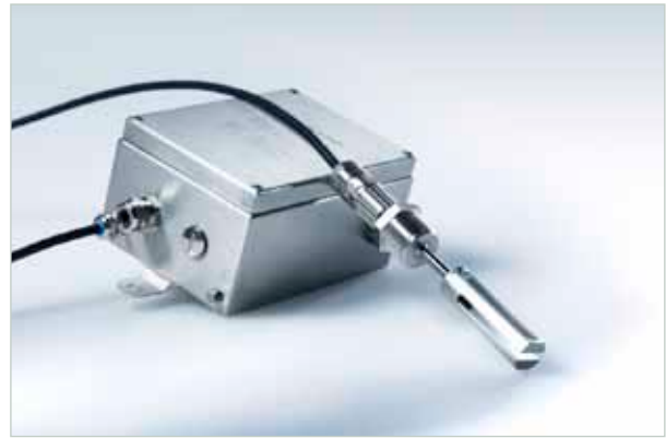
LiquiSonic® Tauchsensormodul zur Öllkonzentrationsmessung

Die spezielle Sensorelektronik befindet sich in einem vom Sensor abgesetzten Edelstahlgehäuse mit Schutzart IP68.