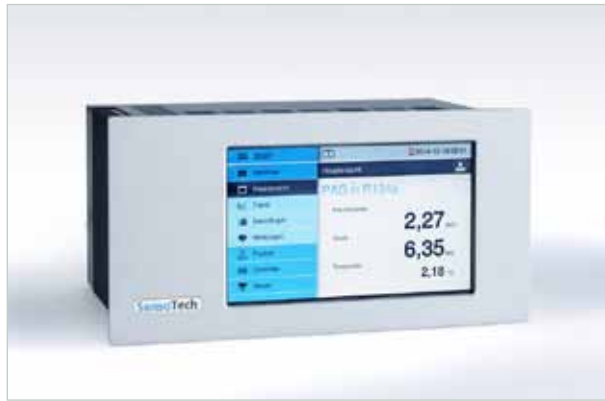
LiquiSonic® Controller 30

Die Spannungsversorgung des Controllers beträgt 100 - 240 V AC, 50 - 60 Hz. Optional sind auch 24 V DC (10 - 32 V DC) erhältlich, was sich besonders für den mobilen Einsatz der Geräte bewährt hat.