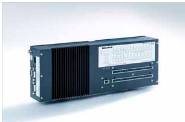
LiquiSonic® Controller 5 für OEM-Kältemittelapplikationen

Durch die platzsparende Konstruktion mit Hutschienenmontage ist der Controller 5 besonders gut als OEM-Gerät für die Ausrüstung von Fahrzeugen und für die Integration im Teststandbau geeignet. Zusätzlich zu den üblichen Schnittstellen steht hierfür auch die Einbindung über CAN-Bus zur Verfügung. Die Spannungsversorgung des Controllers beträgt 24 V DC ( \pm 15\% ). Optional ist auch ein Weitbereichsspannungseingang mit 10 - 32 V DC erhältlich.